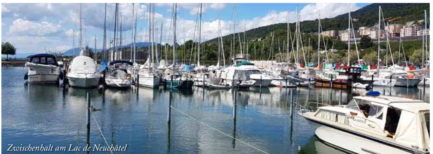
Zwischenhalt am Lac de Neuchâtel

Weiterbildungsreise der Musiklehrpersonen und Musikschulkommission in den Jura. Auch die Architektur und Geschichte kamen nicht zu kurz.