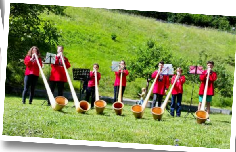
Impressionen vom Auftritt bei der ARGO in Tiefencastel.